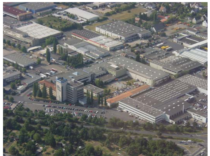
Liegenschaft in Kassel

Weitere Anforderungen sind Wartung, Instandhaltung, Reparaturen und Prüfungen von: A - Z (alles von „A“ wie Aufzug bis „W“ wie Wandhydrant)